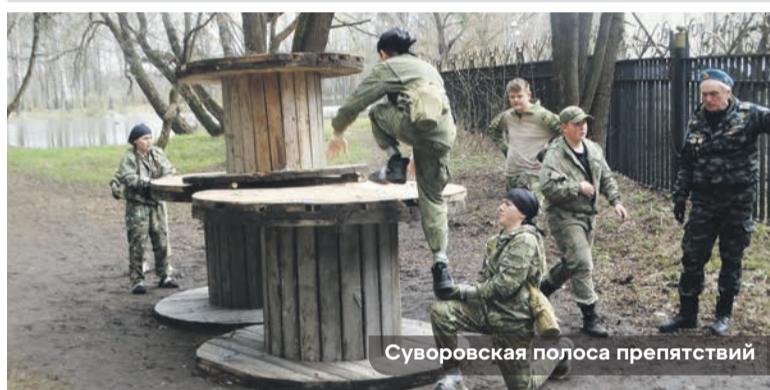
Суворовская полоса препятствий