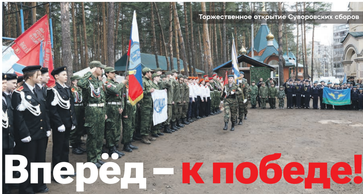
Торжественное открытие Суворовских сборов