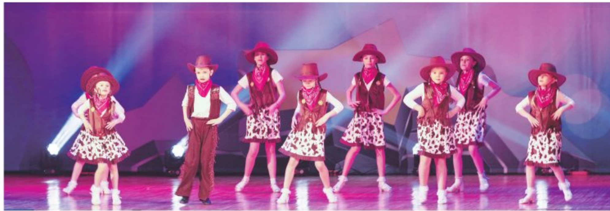
Раменский Центр развития творчества детей и юношества отметил юбилейный день рождения

Юбилейный день рождения отпраздновали ярко и торжественно в Большом зале ДК «Сатурн», который, кстати, был заполнен до отказа. Это и неудивительно, ведь за три с половиной десятилетия в Центре развития творчества детей и юношества получили дополнительное образование тысячи девочек и мальчишек, которые теперь сами стали родителями и привели туда своих детишек.