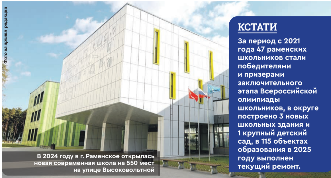
В 2024 году в г. Раменское открылась новая современная школа на 550 мест на улице Высоковольной

– Мы приняли очень важное, во многом символическое, но на деле глубоко содержательное решение – убрали из закона об образовании понятие