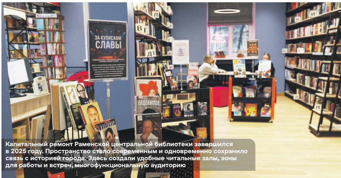
Капитальный ремонт Раменской центральной библиотеки завершился в 2025 году. Пространство стало современным и одновременно сохранило связь с историей города. Здесь создали удобные читальные залы, зоны для работы и встреч, многофункциональную аудиторию

В 2024 году на базе ДК им. Воровского начала работу инклюзивная творческая лаборатория. Ее главная задача – помочь людям с ограниченными возможностями здоровья раскрыть свои таланты и почувствовать себя частью большого творческого сообщества. В детском центре «Пионер» для детей с ОВЗ работает сенсорно-динамическая комната «Дом Совы», где проходят коррекционно-развивающие занятия.