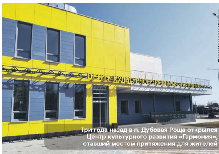
Три года назад в п. Дубовая Роща открылся Центр культурного развития «Гармония», ставший местом притяжения для жителей

Глава округа вместе с родительским коллективом осмо-