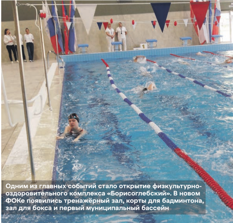
Одним из главных событий стало открытие физкультурно-оздоровительного комплекса «Борисоглебский». В новом ФОКе появились тренажёрный зал, корты для бадминтона, зал для бокса и первый муниципальный бассейн

Мы последовательно развиваем массовый спорт, поддерживаем детско-юношеские