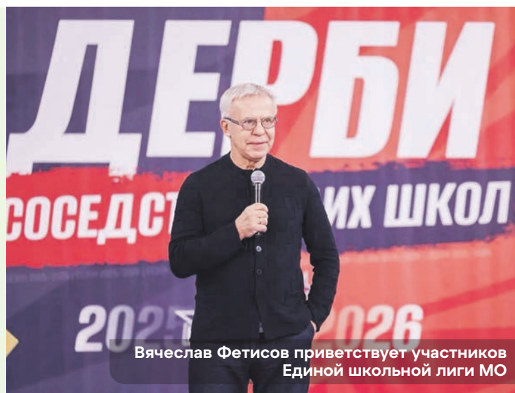
Вячеслав Фетисов приветствует участников Единой школьной лиги МО

ВЯЧЕСЛАВ ФЕТИСОВ, депутат Государственной Думы, член Высшего совета партии «Единая Россия»