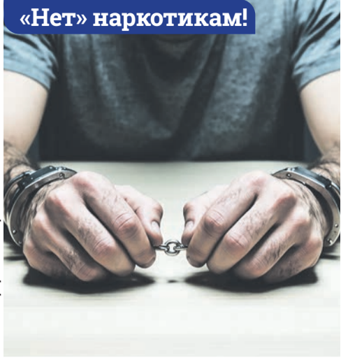
Фото сгенерировано нейросетью