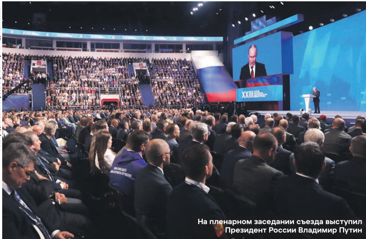
На пленарном заседании съезда выступил Президент России Владимир Путин

«Единая Россия» утвердила кандидатов для участия в предстоящих выборах в Государственную Думу